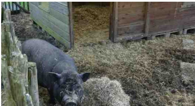
Dagbesteding bij De Munninkhof Rheden

Participeren in de samenleving kan onder andere door het hebben van een zinvolle daginvulling. We kijken samen met bewoners wat past bij hun wensen en interesses. Een van de mogelijkheden in de buurt is bijv. Zorgboerderij De Munninkhof in Rheden.