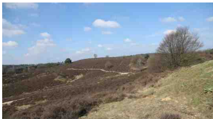
Ook de Posbank is op loopafstand te bereiken

Rheden is een dorp, dichtbij Velp en Arnhem, dat beschikt over een treinstation. In het centrum zijn diverse winkels, een bank, een kapper en supermarkten. Verder heeft Rheden ook diverse sportclubs en er worden veel dorpsactiviteiten georganiseerd. Ook op recreatief gebied is alles bij de hand. Rheden ligt aan de IJssel waar men heerlijk langs kan wandelen en fietsen. Ook natuurgebied Veluwezoom en het prachtige recreatiegebied Rhederlaag, liggen op een steenworp afstand.